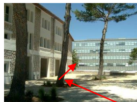
Bât G. Mégie – 1 er étage Collège Coopératif PAM