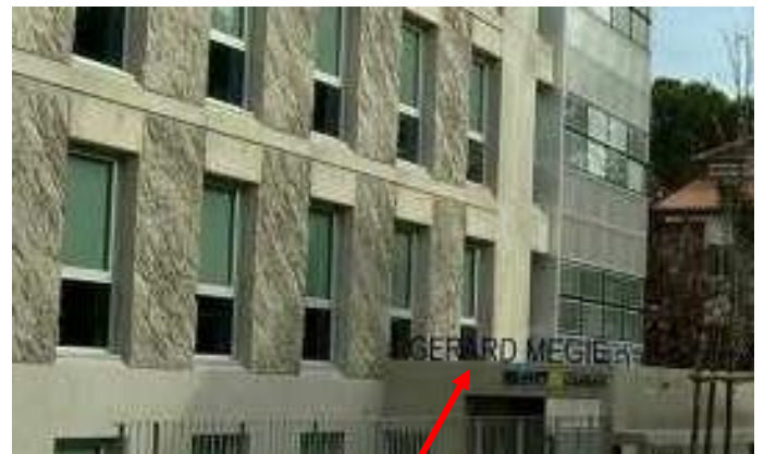
Bât Gérard Mégie (nom en contrebas)